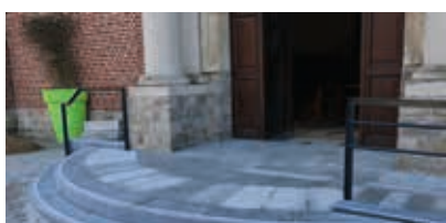
10-12 Retour sur les travaux