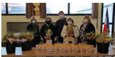
8 Merci aux bénévoles durant la crise