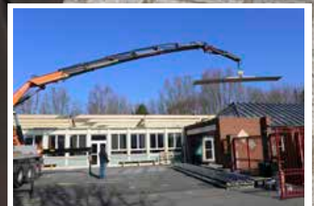
Le point sur tous les travaux dans la commune