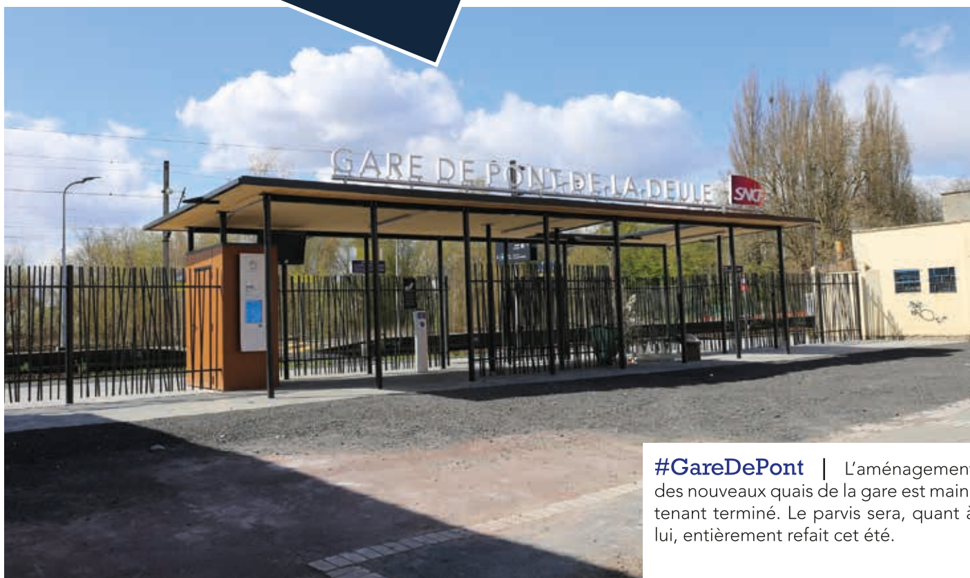
#GareDePont | L'aménagement des nouveaux quais de la gare est maintenant terminé. Le parvis sera, quant à lui, entièrement refait cet été.

#Merci | Les couturières bénévoles qui, à la suite du premier confinement en mars 2020, se sont lancées dans la confection de masque de protection contre le virus. Leur travail a permis de nous aider à fournir suffisamment de masques pour toute la population flersoise.