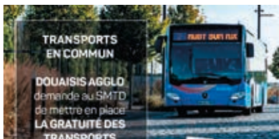
5 Mobilité : quoi de neuf?