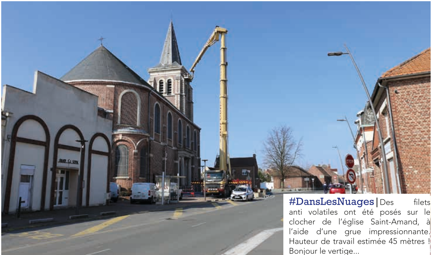
#DansLesNuages | Des filets anti volatiles ont été posés sur le clocher de l'église Saint-Amand, à l'aide d'une grue impressionnante. Hauteur de travail estimée 45 mètres ! Bonjour le vertige...