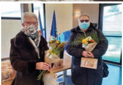
Les couturières bénévoles de la crise sanitaire à l'honneur.