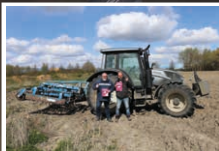
Les élus et les Flersois mobilisés pour la BNF dans le Douaisis.