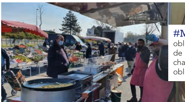
#MarchéDePont | Malgré la Covid-19 qui nous oblige à vivre avec de nombreuses restrictions, le marché de Pont-de-la-Deûle tient bon et continue de se dérouler chaque vendredi matin. Les gestes «barrières» sont bien-sûr obligatoires sur le marché.