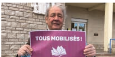
6 Tous mobilisés pour la BNF dans le Douaisis