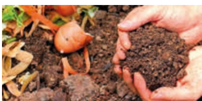
14 Mettez-vous au compostage !